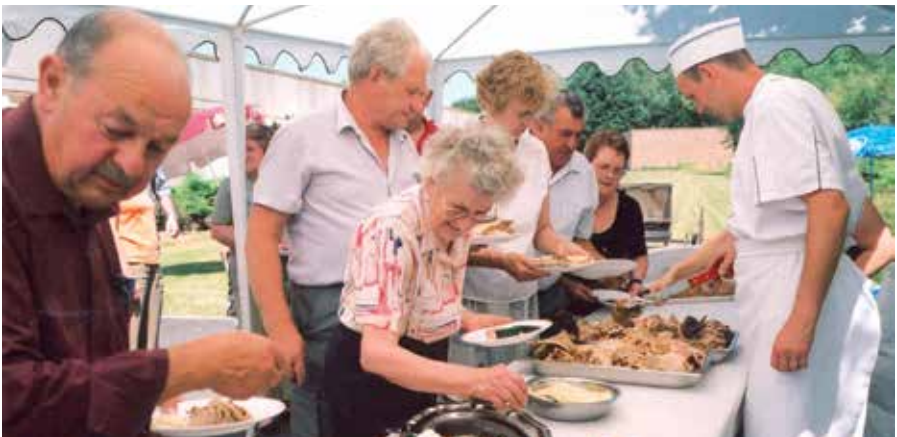
Résidence ORPEA de Fontaine-au-pire (59)

Ce service de préparation et de livraison de repas à domicile vous octroiera quelques heures de temps libre par jour.