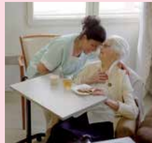
Résidence ORPEA de Courbevoie (92)