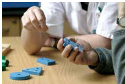
Clinique SSR de Viry-Chatillon (91)