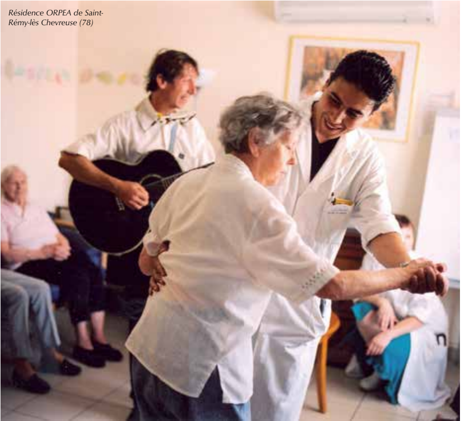
Résidence ORPEA de Saint- Rémy-lès Chevreuse (78)