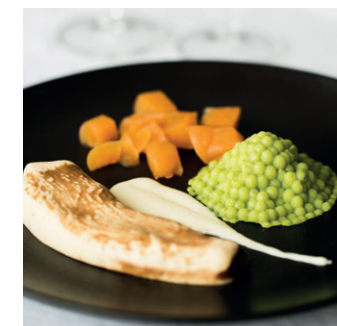
Exemple de plat en texture modifiée pour répondre aux besoins des résidents.