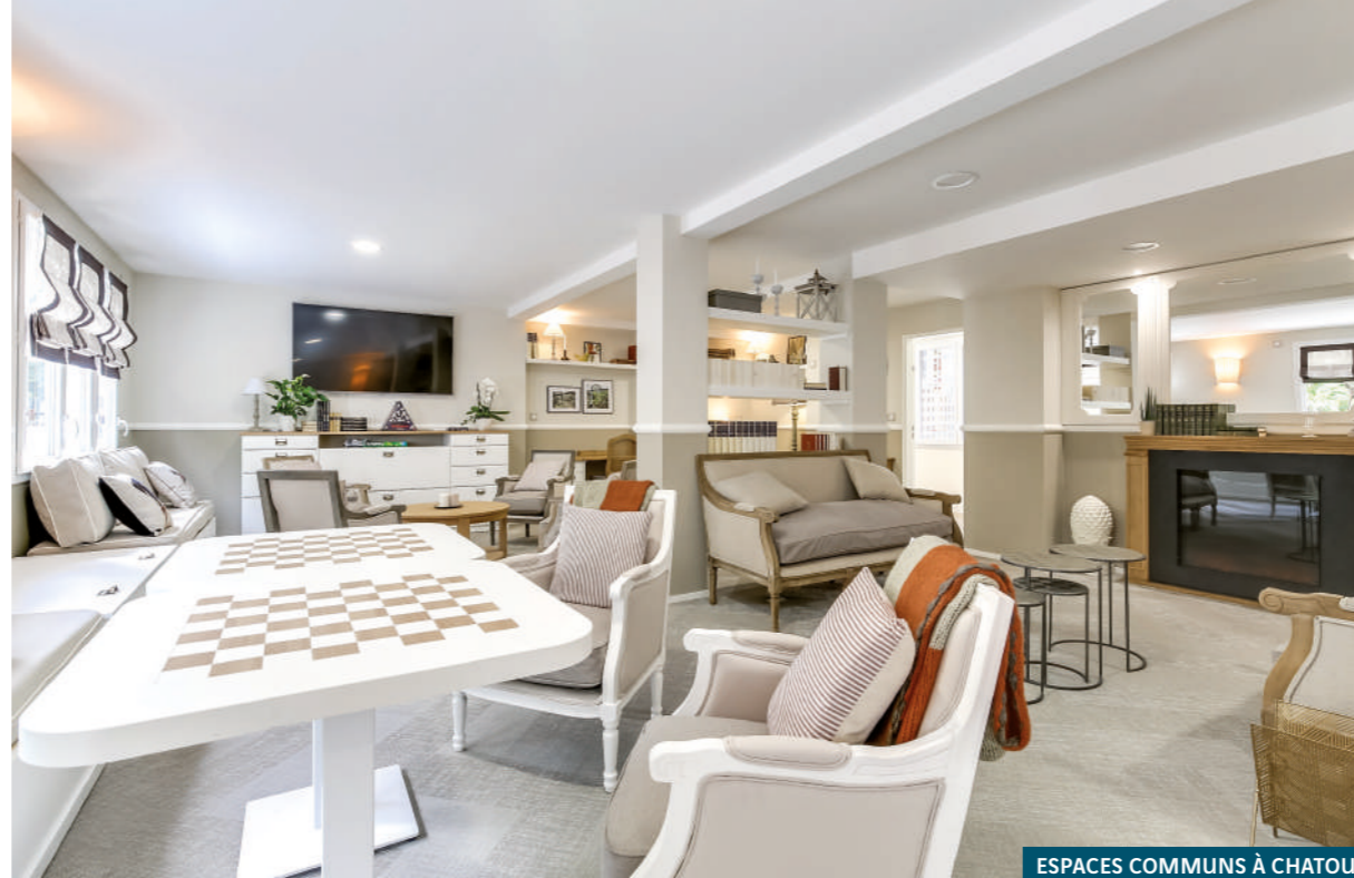
ESPACES COMMUNS À CHATOU