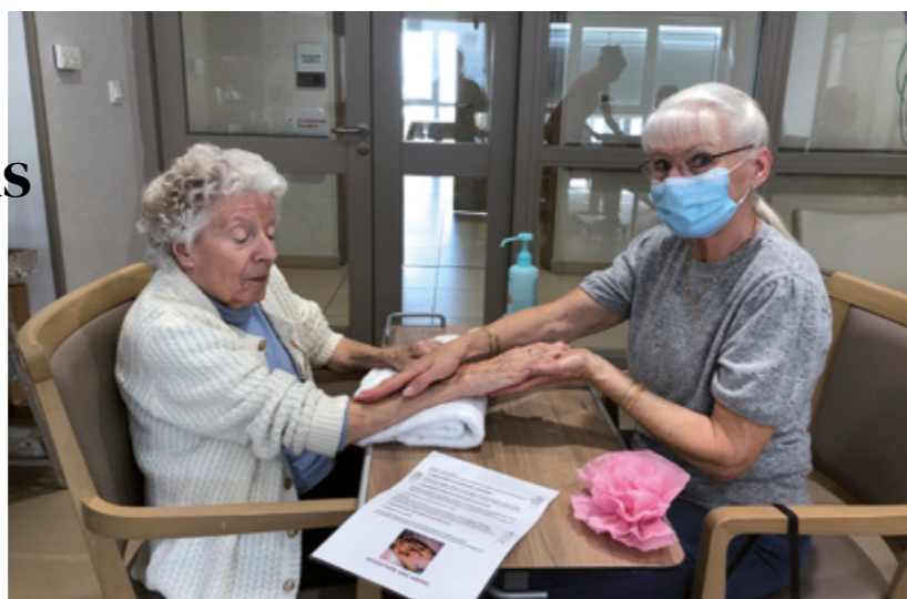
Atelier de modelage des mains, animé par une socio-esthéticienne, pour un moment de partage aidants-aidés.

Sous l'impulsion de nos professionnels qualifiés, la démarche SENS vise à faire évoluer l'accompagnement des personnes atteintes de maladies neuro-évolutives.