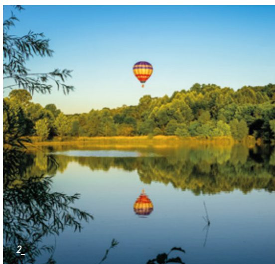
2_ La beauté et la quiétude d'un environnement préservé où l'on peut apercevoir les Montgolfières sur la Loire.