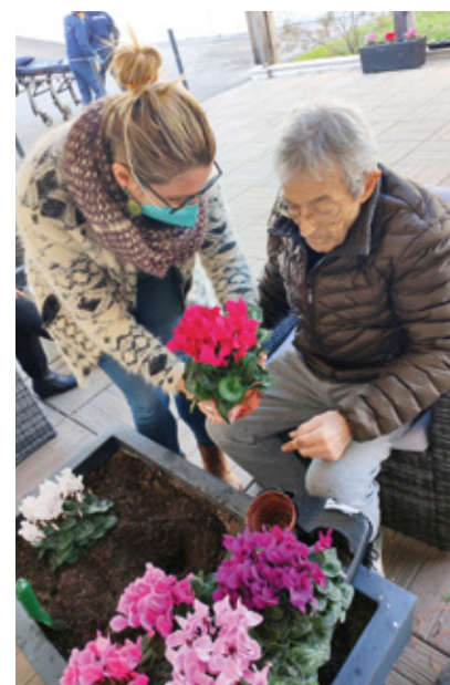
L'attribution de rôles vise à intégrer le résident au sein de la communauté, par la réalisation de tâches essentielles à la vie en collectivité