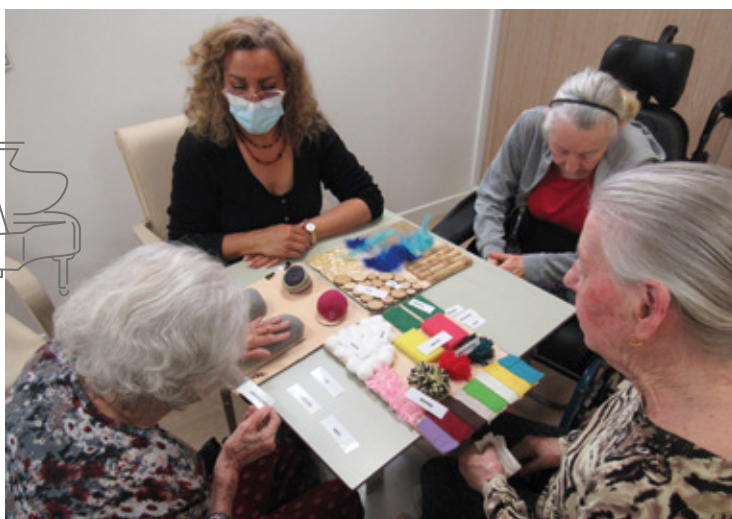
Activité animée par notre art-thérapeute, à partir de panneaux sensoriels, pour stimuler le sens du toucher, dévier l'attention et calmer les angoisses