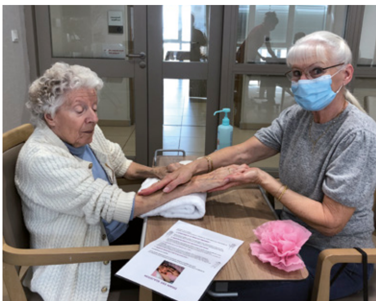
Atelier de modelage des mains, animé par une socio esthéticienne, pour un moment de partage aidants aidés

Elle s'appuie sur les compétences terrain de nos professionnels et s'organise autour d'un comité de pilotage pluridisciplinaire. Elle nous permet de participer activement aux enjeux et débats liés aux maladies neuro-évolutives.