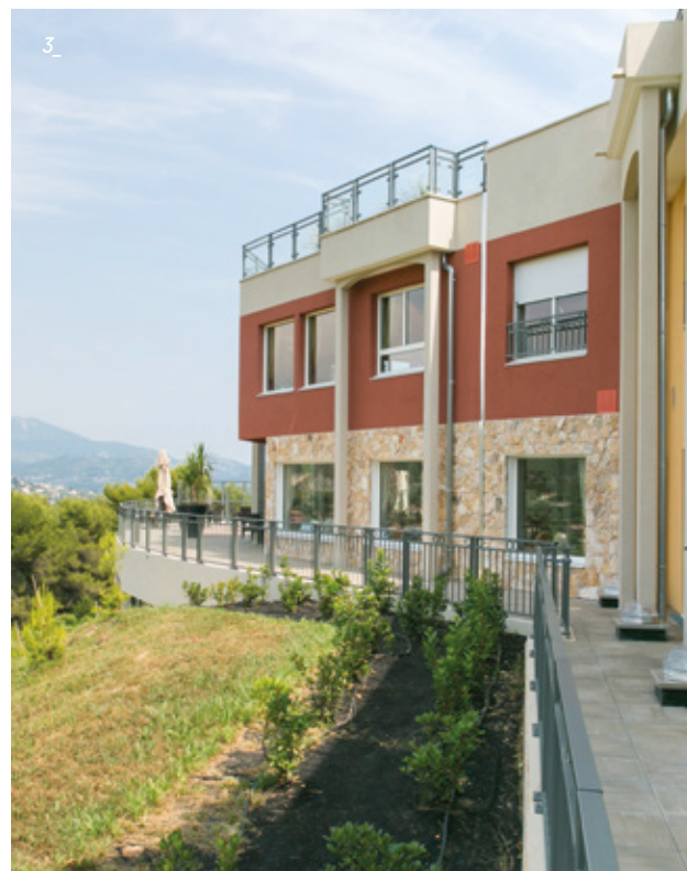
3_ Son mobilier et sa décoration soignée apportent beaucoup de prestance à cette résidence à l'allure élégante et moderne.

La pureté des lignes qui constitue l'ensemble architectural de la Villa de Rimiez lui confère un style contemporain et chaleureux.