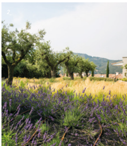
2_ Les oliviers centenaires et les bouquets de lavande à perte de vue constituent à eux seuls toute la sagesse de ces paysages provençaux séculaires.