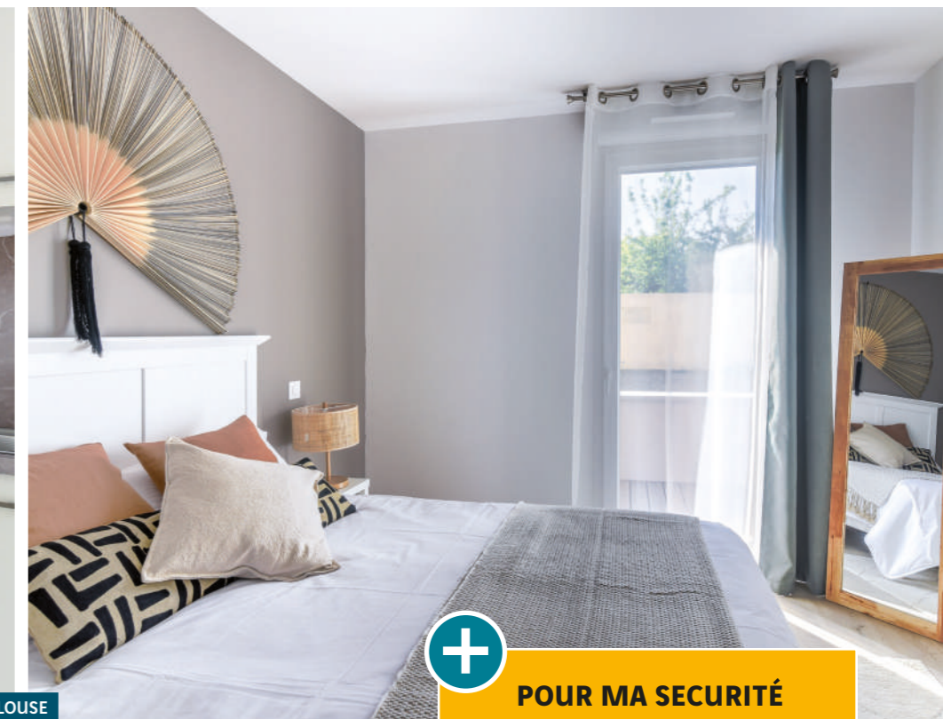
APPARTEMENT TÉMOIN À TOULOUSE

“ Le confort et la sécurité d'un logement adapté