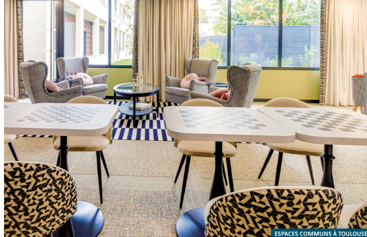
ESPACES COMMUNS À TOULOUSE