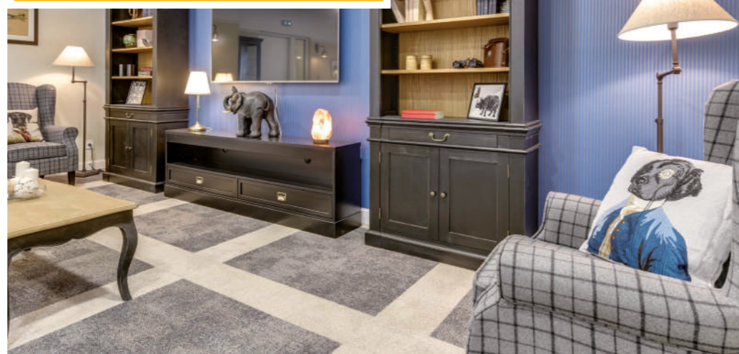
MÉDIATHÈQUE À BORDEAUX