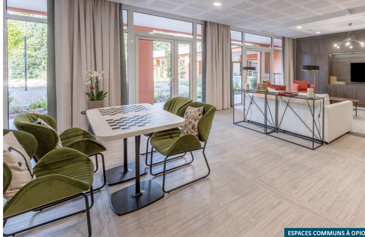
ESPACES COMMUNS À OPIO