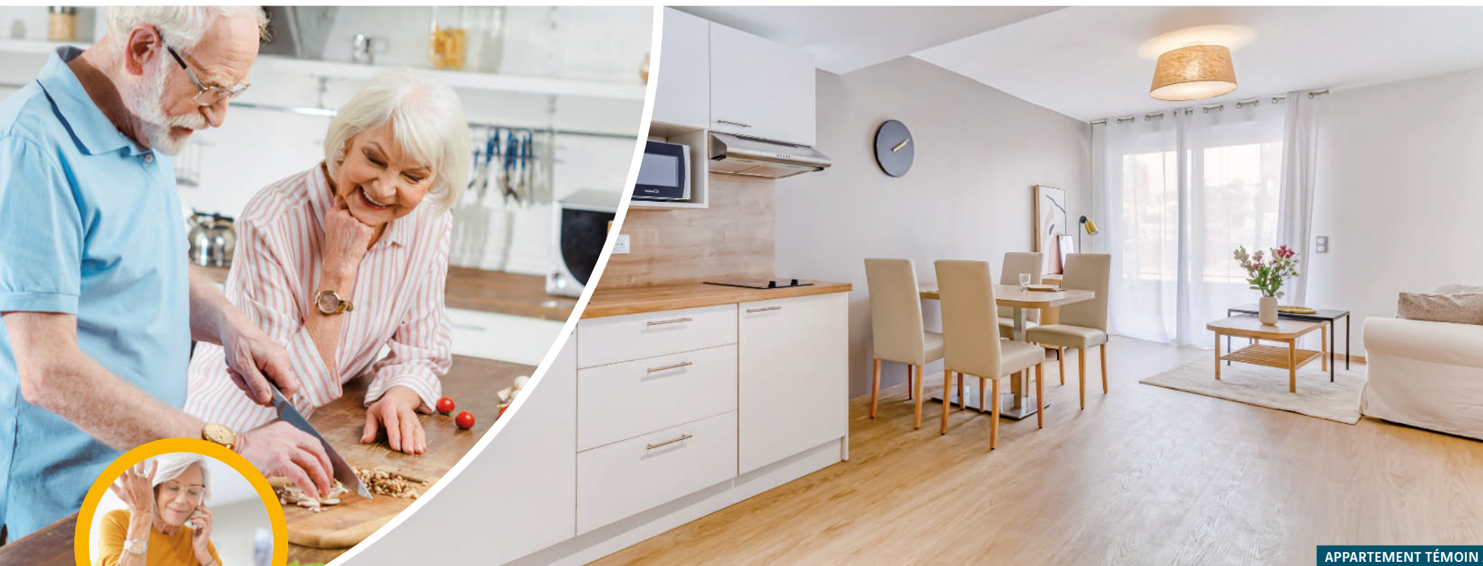
APPARTEMENT TÉMOIN À VILLENEUVE-LOUBET