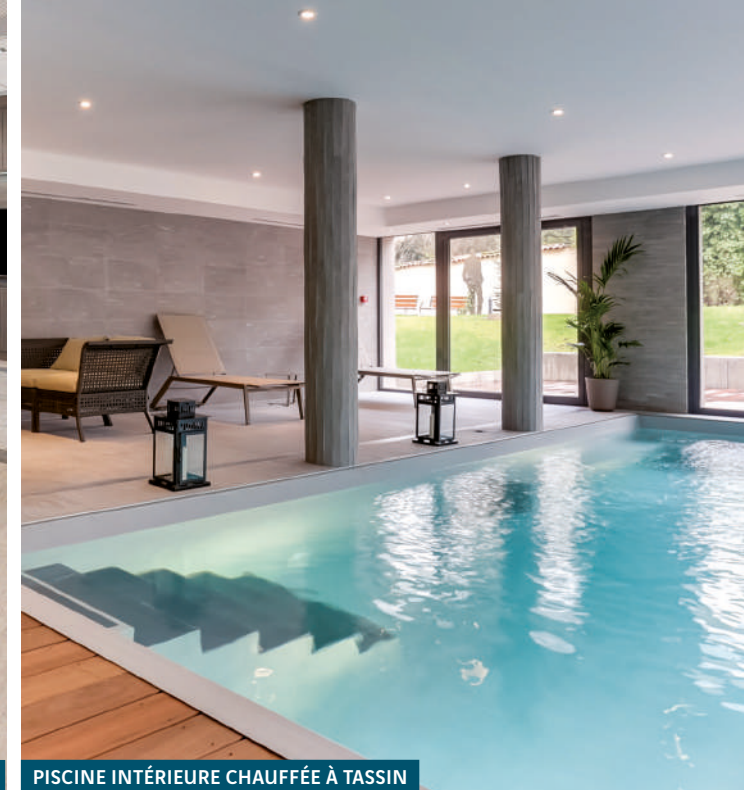
PISCINE INTÉRIEURE CHAUFFÉE À TASSIN