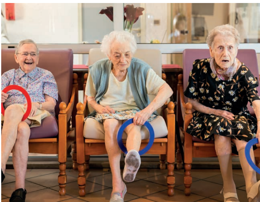
Travail sur l'équilibre et la gymnastique douce avec notre Coordinatrice de projets d'animation.

Les poupées empathiques, comme le célèbre phoque Paro que nous utilisons à la Villa Bourgaïth, suscitent des émotions positives chez les résidents. Elles contribuent à apaiser les tensions et à faciliter les soins.