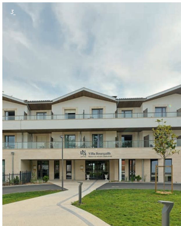
3_ Le cadre exceptionnel de cette résidence pleine de charme constitue un véritable havre de paix pour ses résidents.

La Villa Bourgailh est une résidence très agréable, agrémentée d'espaces extérieurs très bien conçus pour pouvoir se ressourcer en toute sérénité.