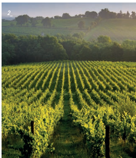
2_ Le vignoble bordelais qui s'étend sur une grande partie de la Gironde est l'un des plus anciens et prestigieux au monde.