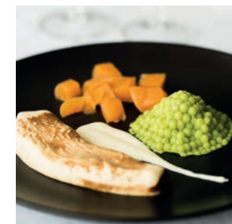
Exemple de plat en texture modifiée pour répondre aux besoins des résidents.