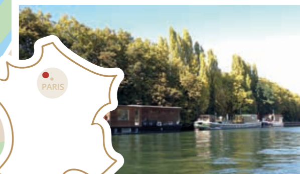
Quais de Seine, Puteaux