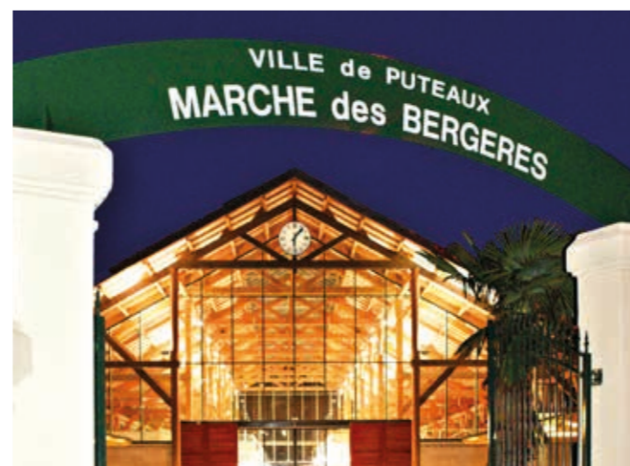
Marché des Bergères, Puteaux

Située au cœur de l'EcoQuartier des Bergères, la Villa Médicis Puteaux vous offre un cadre de vie optimal par son emplacement privilégié au calme et à proximité des principaux commerces.