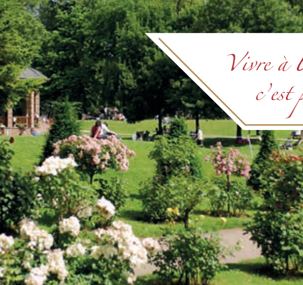
L'île de Puteaux

Vivre à la Villa Médicis Puteaux, c'est profiter de la douceur de vivre !