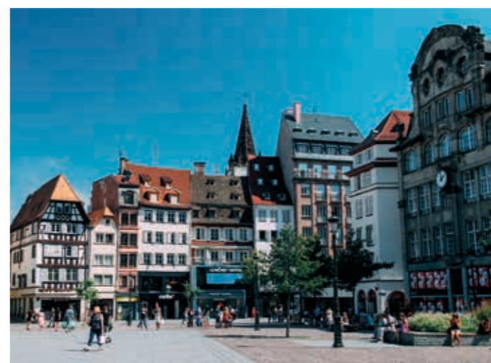
Place Kleber - Strasbourg

Située au cœur de la ville, la Villa Médicis Strasbourg vous offre un cadre de vie optimal par son emplacement privilégié à proximité immédiate de très nombreux commerces de proximités et transports en commun.