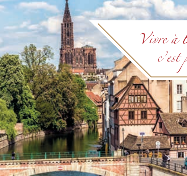
Ponts Couverts - Strasbourg

Vivre à la Villa Médicis Strasbourg, c'est profiter de la douceur de vivre !