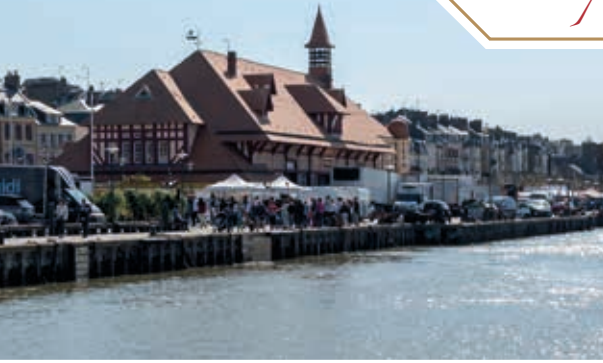
Marché aux Poissons - Trouville-sur-Mer

Vivre à la Villa Médicis Trouville-sur-Mer ~ Deauville, c'est profiter de la douceur de vivre !