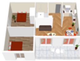
PLAN TYPE T3