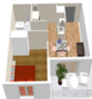
PLAN TYPE T2