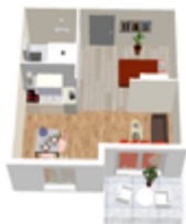
PLAN TYPE T1BIS